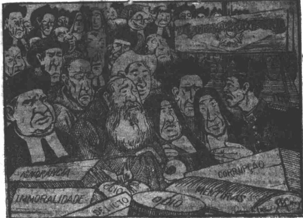
O GUARDA DA ALFANDEGA: Traxem alguma coisa prohibida? ELLES: Nada! Tudo que traxemos é permitido... á Igreja... no Brasil.

Em vez de ter vindo pregando os bons principios ao povo, protegendo os opprimidos, libertando os algemados, não, ella parece ter querido vingar-se do que soffreu no tempo de Nero, e mais vingativa, mais cruel, mais des-humana, mais perversa que o monstro romano, ella fez brotar de seus caprichos e de seu rancor esse crime mais que horrendo — a Inquisição, muito mais terrivel e muito mais barbaço que o flagello de Cesar.